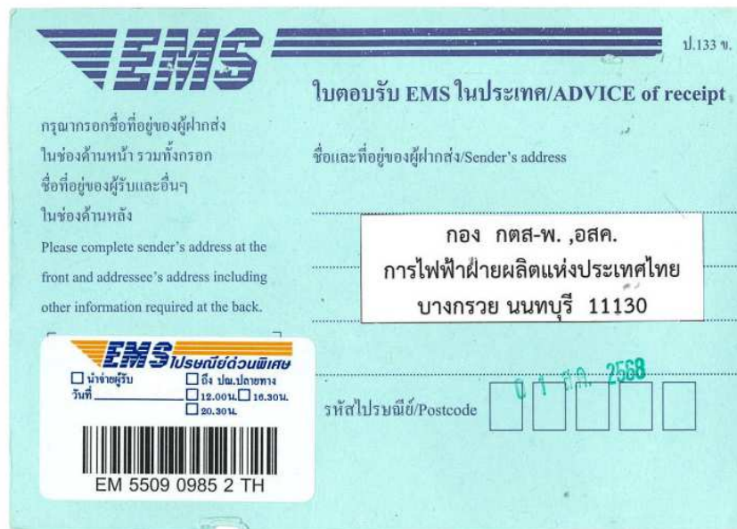
รูปที่ ค-1 (ต่อ) รูปถ่ายสำเนาหนังสือนำเสนอรายงานผลการปฏิบัติตามมาตรการป้องกัน และแก้ไขผลกระทบสิ่งแวดล้อม ฉบับที่ 30 (มกราคม-มิถุนายน 2568) ต่อหน่วยงานราชการ